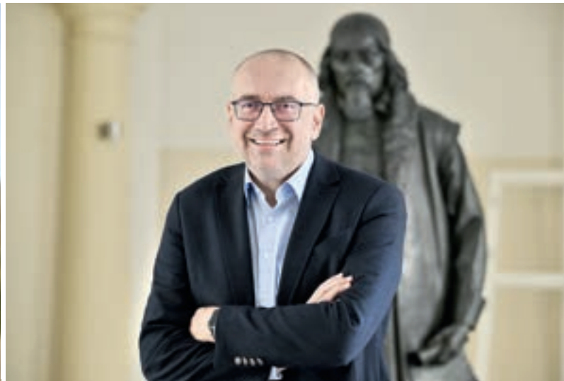
Mikuláš Bek (STAN), ministr školství, mládeže a tělovýchovy

To chystaná škola v Louňovicích na východ od Prahy na první výkop teprve čeká. Tady má vzniknout velká svazková škola pro děti ze čtyř vesnic, které teď základní